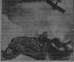
“Un globo cayó destrozado y ardiendo” — “Cayó sobre el summo del río” — “Se escondió junto al camino mientras los alemanes pasaban”.